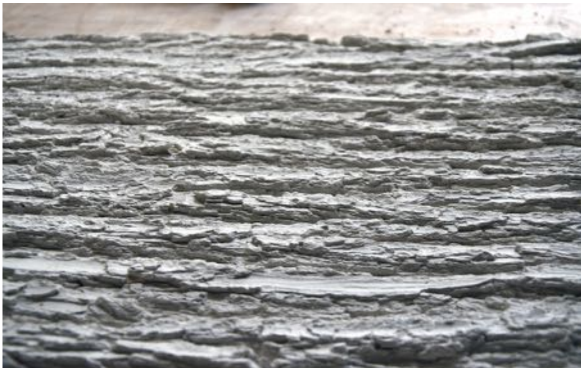
Détail d'un moule du projet Matrice .