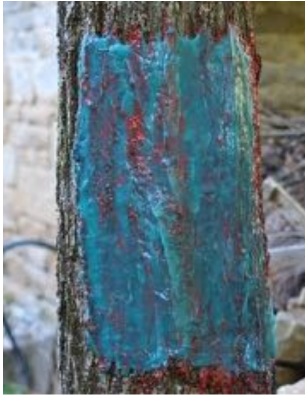
Prise d'empreinte sur un arbre.